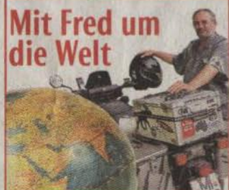
Mit Fred um die Welt

Von Phuket aus machte sich der Weltenbummler dann auf den Weg zur Ostküste Thai-